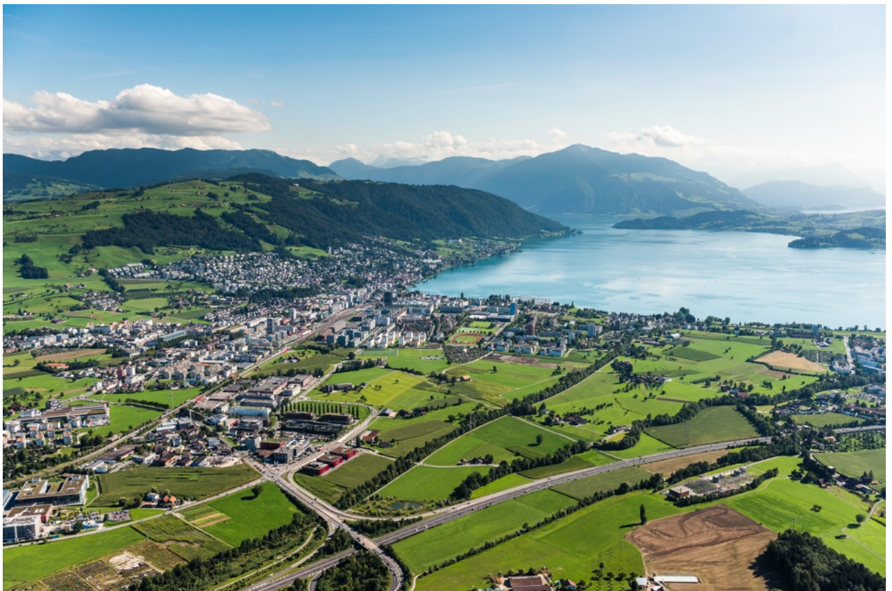
Abbildung 1: Blick von Norden auf die Lorzenebene.

Preisträgerinnen: Korporation Zug (stellvertretend für Landeigentümer:innen), Kanton Zug, Stadt Zug sowie Gemeinden Baar, Cham und Steinhausen