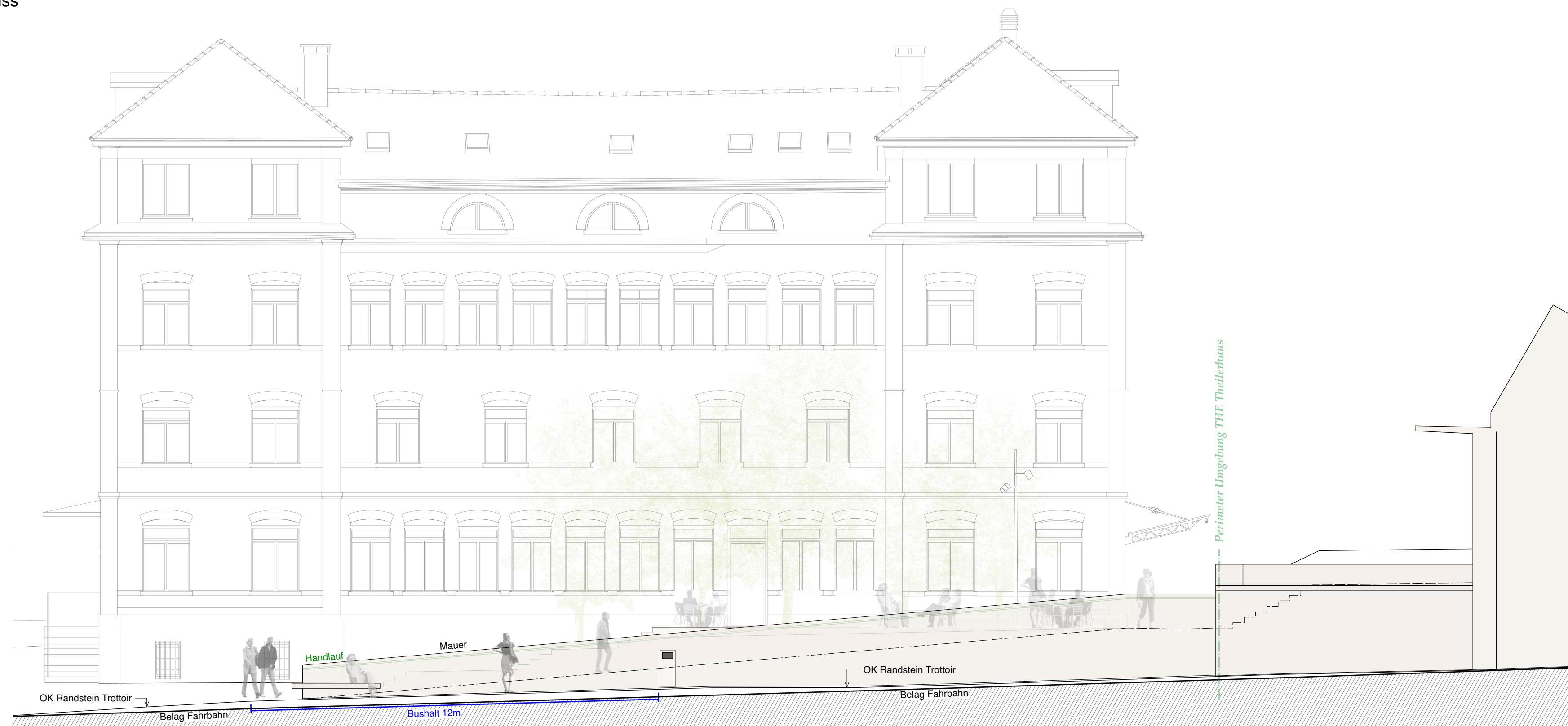
Aussenansicht Stützmauer mit Geländer und Bushaltestelle